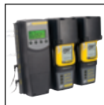
与 MicroDock II 兼容