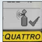
易于操作， 视觉确认合规